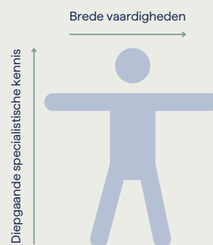
Afbeelding 1: de 'T-shaped professional'

In de afgelopen jaren heeft de verschuiving naar specialisatie ervoor gezorgd dat interim professionals niet alleen meer gefocust zijn op hun specifieke expertise, maar ook flexibeler inzetbaar zijn geworden. Deze ontwikkeling weerspiegelt de groeiende vraag naar 'T-shaped professionals'. Interim professionals hebben een verticale expertise in specifieke domeinen zoals ESG-rapportage, risicomanagement of cybersecurity, terwijl ze tegelijkertijd brede generalistische vaardigheden inzetten zoals communicatie, samenwerking en strategisch inzicht. Hierdoor kunnen zij niet alleen complexe problemen binnen hun vakgebied oplossen, maar ook effectief functioneren in multidisciplinaire teams waar strategische en operationele doelen samenkomen.